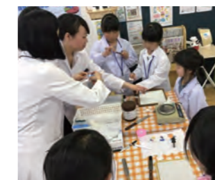
子ども薬剤師体験