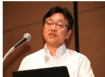
2016年厚生労働省・田宮憲一氏