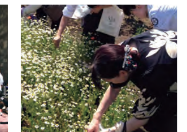
薬草園で薬草摘み