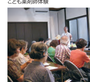
家庭のくすり箱セミナー