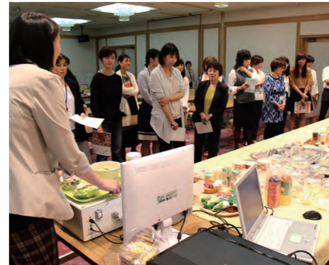
食育SATシステム研修