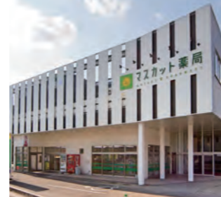
2017年5月 岡山のマスカット薬局を視察