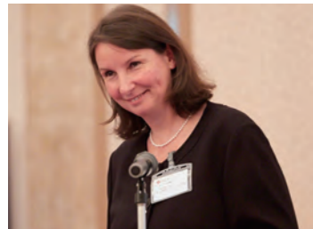
2015年ドイツ薬事博物館長・E.フーヴァ氏