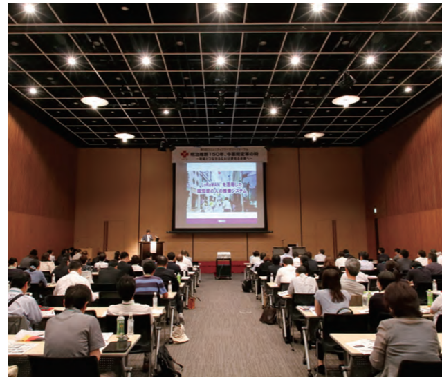
第3回以降の会場となっている秋葉原コンベンションホールでの講演の様子