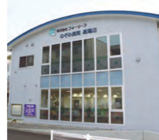
2017年5月 広島島のぞみ薬局を視察