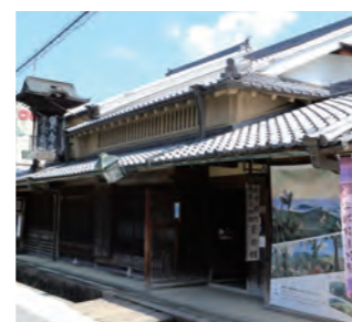
2017年4月 奈良の大宇陀を歩きました