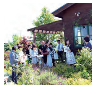
2017年6月 茨城・フローラ薬局のハーブ園で学ぶ