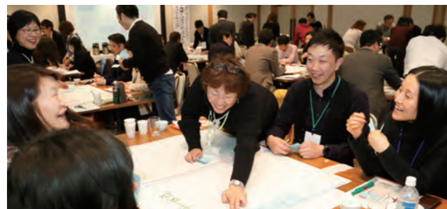
スモールグループに分かれてテーブルワークを実践