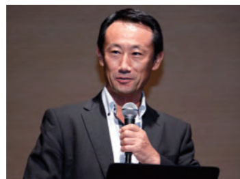
2018年経済産業省・江崎禎英氏