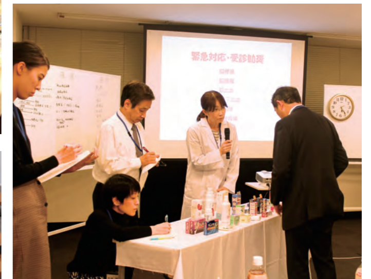
OTC医薬品トリアージ研修