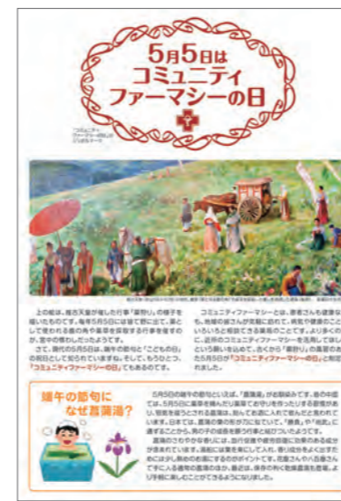
コミュニティファーマシーの日のポスター

ドイツの「薬局の日」に学び、5月5日を「コミュニティファーマシーの日」と記念日協会に登録しました。毎年「コミュニティファーマシーの日」を軸にJACP加盟の薬局では地域の人たちを巻きこんだイベントを開催しています。