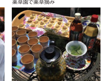
ハーブで作った食品の試食