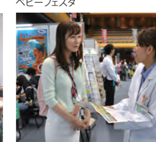
健康セミナーで相談応需