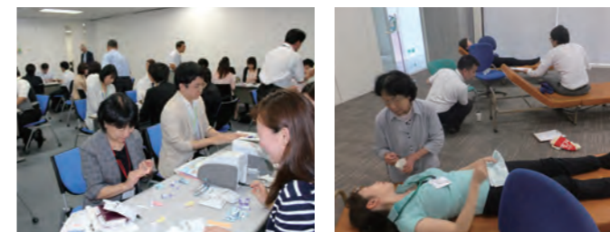
検体測定体験研修